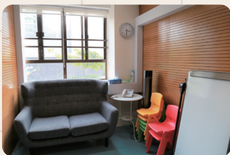
愛·談天 配有隔音設備的會談空間