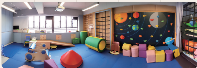
愛·探索 — 感覺統合訓練室