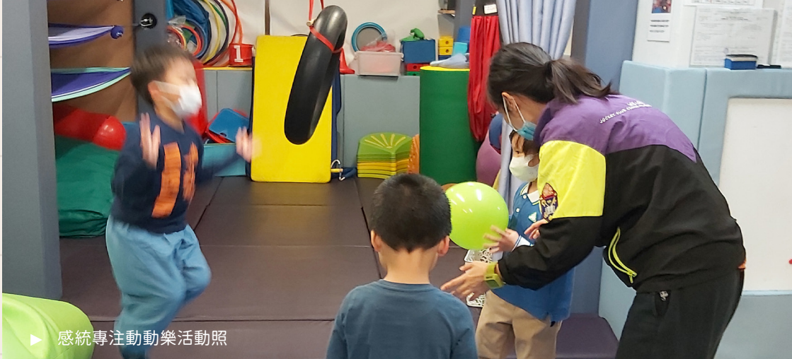
▶ 感統專注動樂活動照